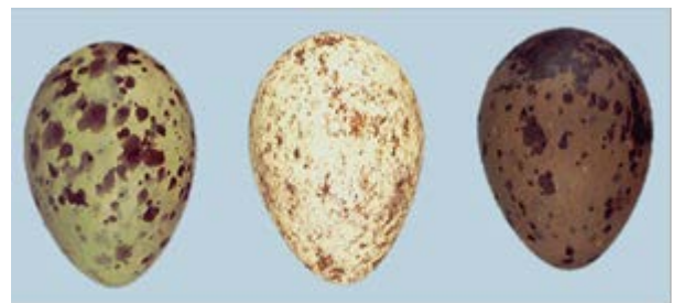
Abb. 1: Farbvarianten von Silbermöweneiern (Optimedia 1998)

Der Schalengrund der spindelförmigen, ca. 70 x 49 cm großen Silbermöweneier ist meist hell oliv, grün oder rostbraun, kann aber von weißlich-blau bis tief bräunlichrostfarben reichen (Abb. 1). Meist sind darauf schwarze, schwarz-braune oder dunkel olive Flecken oder Punkte ausgebildet; sel-ten ist stattdessen eine unregelmäßige Bekritzelung vorhanden. Zudem kommen dichte Zeichnun-gen und dürrtliche Fleckungen vor. Ungezeichnete Eier sind selten (Harrison 1975).